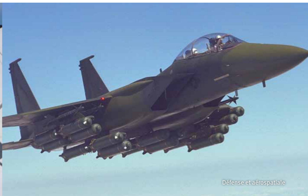
Défense et aérospatiale