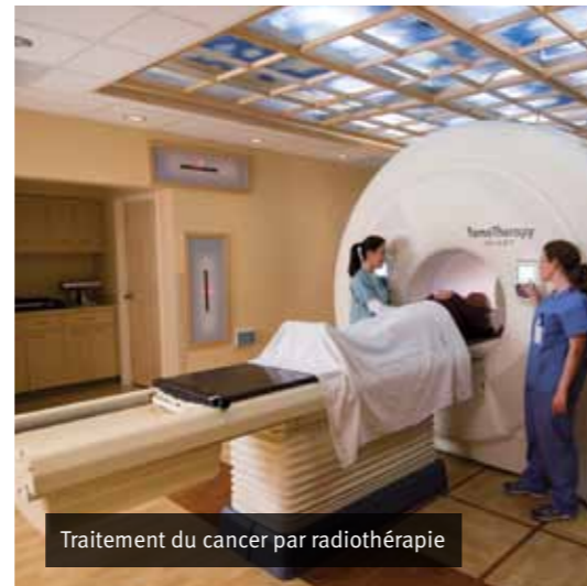
Traitement du cancer par radiothérapie

Les divisions proposent des solutions qui ciblent des segments d'applications correspondant aux besoins de spécialistes dans le monde.